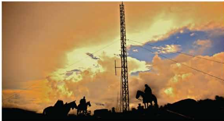
La familia de misiones VOM alrededor del mundo apoya a un programa de radio cristiano de Colombia que incluye una red de torres de transmisión a través del país. Muchos guerrilleros en contra del gobierno han entregado sus vidas a Cristo después de escuchar los programas cristianos.

Por años, VOM ha suplido a Neta con Biblias y otras necesidades para los cristianos en las zonas rojas. Neta también