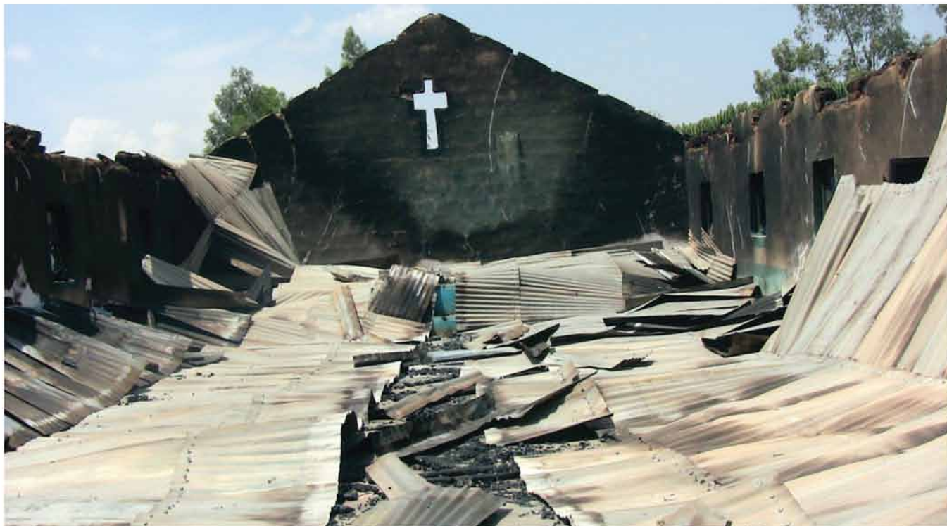
El edificio de la Iglesia de Cristo en Dogo Nabawa, Nigeria, fue quemado durante un ataque musulmán en marzo del 2010. Cuatrocientos cristianos fueron muertos durante el ataque.