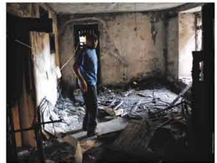
La iglesia Alianza Jerusalén fue quemada a finales de octubre del 2010. La iglesia estaba cerca de una vecindad ultra-ortodoxa.